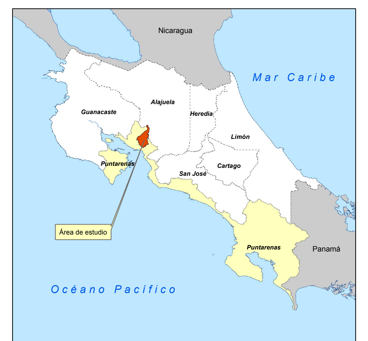
Diagrama de Ubicación